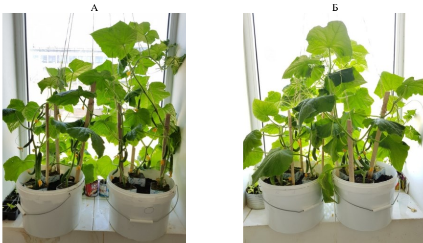
Рис. 1. Растения огурца ( Cucumis sativus L.) сорта Мева при обработке комбинированным биологическим удобрением БиоАзоФосфит на основе штаммов бактерий Raoultella oxytoca MS и Serratia plymuthica MS (А) и в контроле без обработки (Б) на 40-е сут после всходов.

есть потенциал урожайности с одного растения оказался больше при обработке биоудобрением БиоАзоФосфит.