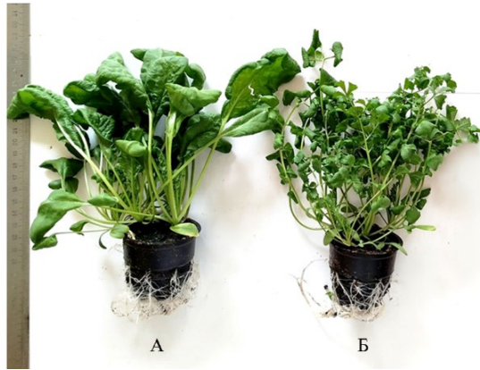
Рис. 2. Растения наиболее перспективных образцов кресс-салата ( Lepidium sativum L.), выращенные в условиях светокультуры на 26-е сут вегетации: А — к-112 (Местный, Азербайджан), Б — к-165 (Gartenkresse, Бельгия) (ФГБНУ Агрофизический НИИ, г. Санкт-Петербург, 2024 год).

образцам 3,88 г, НСР 05 = 1,29), а также средние при фотопериоде 14 ч (3,19 и 3,00 г при средней массе по образцам 2,54 г, НСР 05 = 0,66).