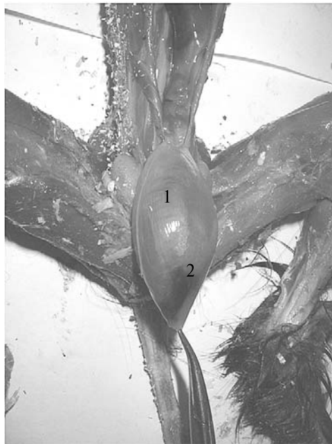
Рис. 1. Геморрагический цистит у 7-месячного самца соболя черного с синдромом недержания мочи: 1 — мочевого пузыря, 2 — геморрагический участок (звероводческое хозяйство «Заря», Ленинградская обл., 2011 год).

Обработку данных выполняли в программе GraphPad Prizm v. 5.0 для Windows XP в соответствии с рекомендациями по медико-биологической статистике (2). Нормальность распределения выборки проверяли с помощью теста Шапиро-Уилка. Полученные данные оценивали методами описательной статистики с определением средних значений и стандартного отклонения в формате M \pm s . Статистическую значимость различий показателей сравниваемых групп определяли методом однофакторного дисперсионного анализа (2). Для сравнения парных выборок, не отвечающих критериям нормальности, использовали U -критерий Манна-Уитни. Различия сравниваемых показателей считали статистически значимыми при p < 0,05 .