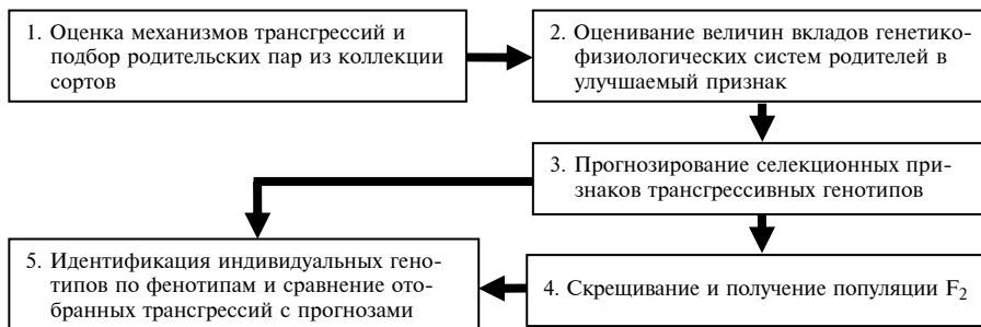
Рис. 1. Блок-схема взаимоотношения задач управления генетико-селекционным процессом.

Основные принципы моделирования системы взаимодействия «генотип—среда» и возможности предложенных моделей для решения ряда базовых задач современной генетики и селекции подробно обсуждались нами ранее (1). Из всех задач, решаемых с помощью таких моделей, выделим наиболее важные (рис. 1): оценка механизмов трансгрессий и подбор родительских пар для обеспечения заданного результата скрещивания; оценивание вкладов (например, в продуктивность) генетико-физиологических систем родительских пар; прогнозирование трансгрессий селекционных признаков в потомстве; скрещивание и получение популяции F 2 ; выделение (идентификация) генотипов по их фенотипам. Эти задачи неразрывно связаны и как единое целое представляют собой аспекты обобщенной проблемы — строгого управления последовательными этапами генетико-селекционного процесса. С разработкой теории, направленной на решение указанной проблемы, связывают одну из ключевых перспектив современной генетики.